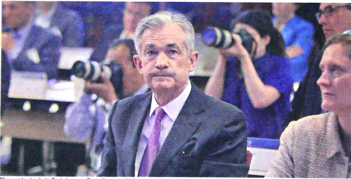
El presidente de la Fed, Jerome Powell, secundó los comentarios de varios miembros de la entidad hacia un recorte de tasas.