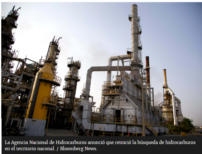
La Agencia Nacional de Hidrocarburos anunció que reinició la búsqueda de hidrocarburos en el territorio nacional.

Ecopetrol como grupo empresarial presentó las mayores ofertas para cinco de los 11 bloques que recibieron ofrecimientos en el Proceso Permanente de Asignación de Áreas PPAA 2019.