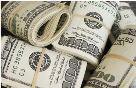
Rollos de dólares