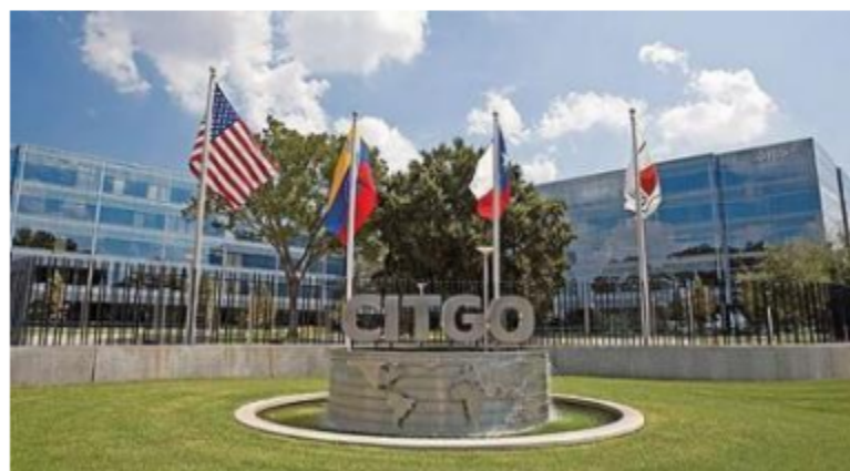
Venezuela dejó de enviar crudo a su filial de Estados Unidos debido a las sanciones que impuso el gobierno de Donald Trump

Marzo de 2019 se convertirá en la historia petrolera como el mes que Citgo, la filial de PDVSA en Estados Unidos, dejó de recibir crudo venezolano debido a las sanciones que impuso el gobierno de Donald Trump; y ese espacio pasó a ser ocupado principalmente por México y la mitad se lo reparten países vecinos de Venezuela como Colombia, Brasil y Trinidad y Tobago.