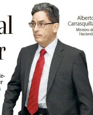
Alberto Carrasquilla Ministro de Hacienda

que ya solo le faltan dos debates en el Congreso para ser realidad atentaría contra la sostenibilidad fiscal del país y el principio de separación de poderes. P4-5