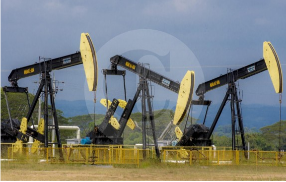
22 empresas están interesadas en explorar potenciales yacimientos de petróleo y gas en Colombia.