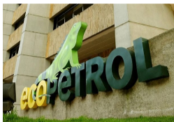
Contraloría revela hallazgos fiscales en Ecopetrol por $145.284 millones a favor...