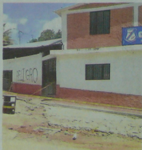
LOS HABITANTES DE LA ZONA bloquearon la vía adyacente, que también se está hundiendo producto de las filtraciones, para mitigar el riesgo de colapso.

"La escuela se encuentra en el aire, estamos huérfanos, qué esperan que ocurra una tragedia para actuar", recaló.