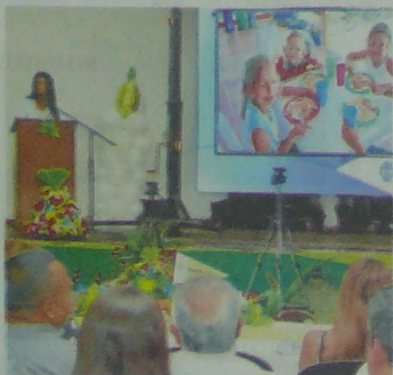
DURANTE LA RENDICIÓN DE CUENTAS se detalló que los niños que resultan beneficiados con el programa deben estar registrados en el Simat.