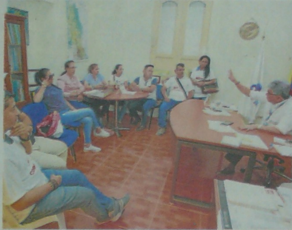
LOS DOCENTES DE SARDINATA se reunieron ayer con el Defensor del Pueblo, Jorge Villamizar, para exigirle apoyo y solicitar que se investigue a los involucrados en la filtración de la información.

La información la suministró en la rendición de cuentas donde precisó que la cobertura del PAE pasó de 60.000 raciones a 116.000 a la fecha.