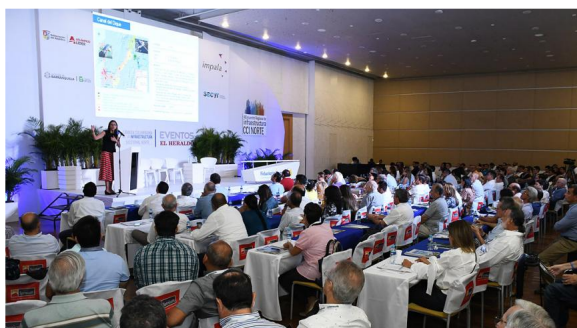
La ministra de Transporte, Ángela María Orozco, interviene en el encuentro.