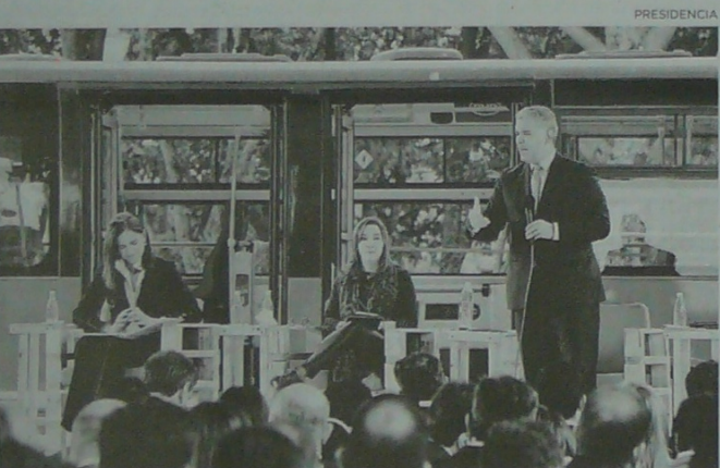
Iván Duque, presidente de Colombia, durante el lanzamiento de la estrategia nacional de movilidad eléctrica y sostenible en el parque Simón Bolívar.

A través del enlace https://wsp.registraduria.gov.co/censo/consultar/ puede consultar su puesto de votación para las elecciones 2019.