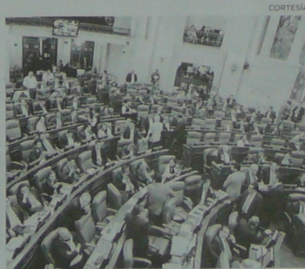
Durante el debate sobre conflicto de intereses en la plenaria de la Cámara de Representantes.