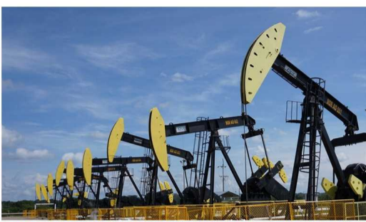
Fracking, apoyo del Consejo Gremial.

Agregación indica que es imprescindible asegurar que dicha técnica se desarrolle bajo los mas altos estándares técnicos que garanticen la protección del ambiente.