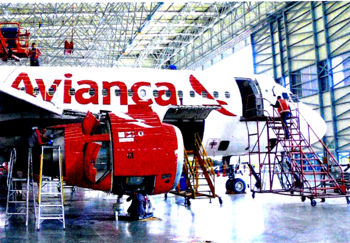
Esta operación es prioritaria para la aerolínea, pues de su éxito depende la estabilización del balance financiero.

Todo indica que la mayoría de los tenedores de bonos por un valor de US$550 millones que vencen en 2020, aceptaron la oferta para intercambiarlos, por otros a mayor plazo. Pág. 4