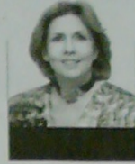
Revolturas GLORIA M.