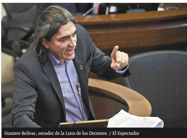
Gustavo Bolívar, senador de la Lista de los Decentes.

El propósito es que los partidos políticos ratifiquen el compromiso con el paquete anticorrupción, producto de la mesa técnica interpartidista que convocó el Gobierno para cumplirle a las más de once millones de personas que votaron la consulta.