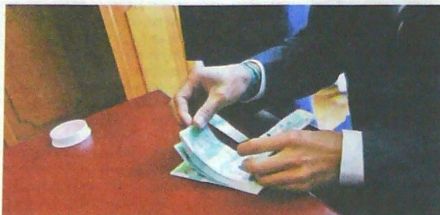
LOS FONDOS de Pensiones son los mayores tenedores de deuda pública con $89,5 billones.

Según la entidad supervisora, las ventas estuvieron encabezadas por el Ministerio de Hacienda que en julio liquidó $0,56 billones y ahora acumula un total de $9,8 billones en deuda pública local. A corte de julio la entidad ha disminuido 1,9% su participación en el total de la deuda. Mientras tanto, las compañías de seguros vendieron $0,08 billones en julio acumulando ahora $16,4 billones.