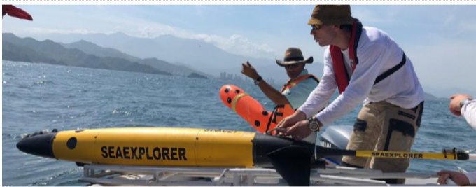
La compañía añadió que los exploradores marinos ayudarán a nutrir los modelos oceanográficos que desde hace más de dos años viene elaborando, a través del Instituto Colombiano del Petróleo, centro de innovación y tecnología de Ecopetrol.

Las operaciones de los exploradores marinos, se harán en una profundidad máxima de 1 kilómetro. Estos equipos son de origen francés, y empezarán a operar entre agosto y diciembre de este años por la firma francesa Alseamar.