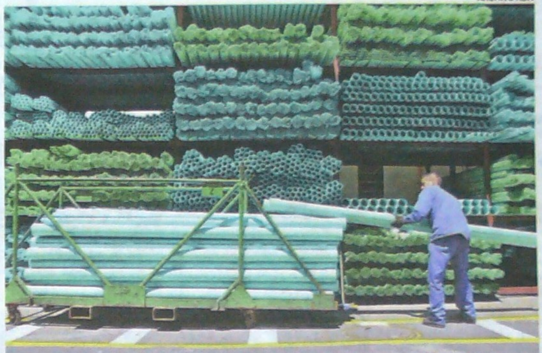
El experto asegura que Colombia está rezagada en el aprovechamiento de residuos de este material.

El PVC o cloruro de polivinilo, requiere para su fabricación 60 % sal común