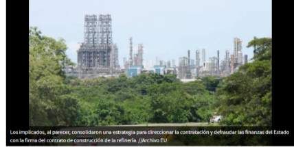
Los implicados, al parecer, consolidaron una estrategia para direccionar la contratación y defraudar las finanzas del Estado con la firma del contrato de construcción de la refinería.

EL UNIVERSAL | @ElUniversalCtg | 23 de agosto de 2019 06:19 PM |