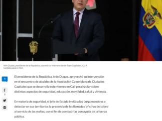
Iván Duque, presidente de la República, durante su intervención en Expo-Capitales 2019. Cartagena El País

Ayer 23, 2019 - 05:02 a.m. | Por Redacción El País