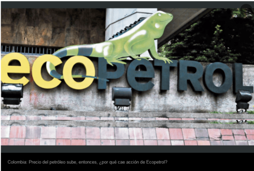
Colombia: Precio del petróleo sube, entonces, ¿por qué cae acción de Ecopetrol?

Por | Economía y Negocios | GDA | Colombia | El Tiempo | 23 de Agosto de 2019 - 17:10 HS