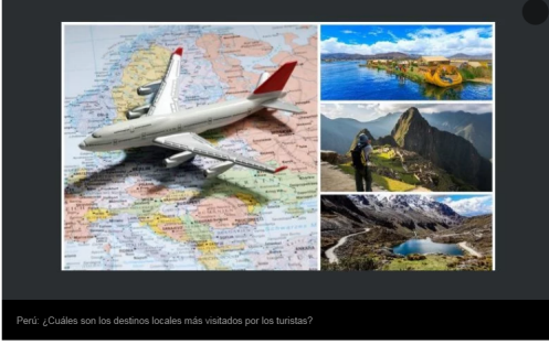
Perú: ¿Cuáles son los destinos locales más visitados por los turistas?

Por | Lucero Chávez | GDA | Perú | El Comercio | 23 de Agosto de 2019 - 18:40 HS