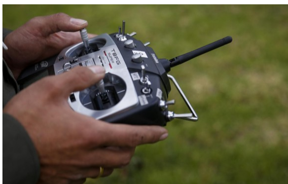
Ecopetrol informó que empleará una tecnología de planeadores submarinos no tripulados.

COLOMBIA | DRONES | ECOPETROL | HIDROCARBUROS | PETRÓLEO | TECNOLOGÍA COLPrensa | PUBLICADO EL 23 DE AGOSTO DE 2019