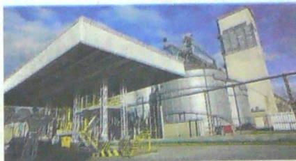
Planta de Nestlé Purina, en Mosquera (Cundinamarca).

Una de las marcas que compiten en el mercado colombiano es Nestlé Purina, que está en el país desde hace más de 60 años y tiene su planta en Mosquera (Cundinamarca). Esta firma asegura tener más del 50% del mercado colombiano y en segmentos