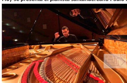
El reconocido pianista Paulo Navarro se presenta a las 7:00 p.m. de hoy en el Teatro Santander.