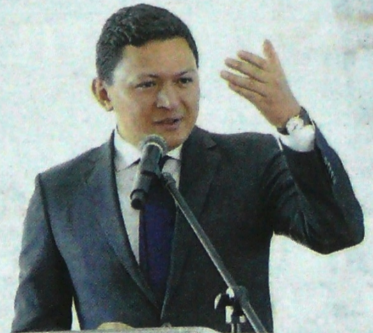
Ministerio de Transporte

Las nuevas troncales tendrán un recorrido de 4,5 kilómetros. La fase II iniciará en la calle 22 y finalizará a la altura de la Calle 5, en el punto conocido como