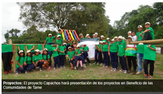
Proyectos: El proyecto Capachos hará presentación de los proyectos en Beneficio de las Comunidades de Tame

El proyecto Capachos, liderado por Parex Resources Colombia Ltd. Sucursal y Ecopetrol S.A, en el marco de su responsabilidad social, realizará el evento de presentación de los proyectos en Beneficio de las Comunidades (PBC), concertados y ejecutados para el año 2018, en las áreas de influencia directa del municipio de Tame, departamento de Arauca.