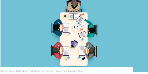
Estas son hoy las fortalezas y debilidades de la economía nacional

Un análisis de las principales problemáticas actuales de la economía nacional.