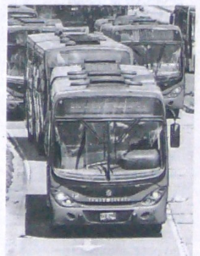
Estas obras demandan inversiones por más de $5 billones.