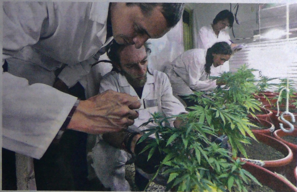
En el 2020 el país tendría más sustento para justificar la asignación de una producción mayor.

El Consejo Gremial, Anif, Fasecolda y analistas han expresado su desacuerdo con gran parte de los artículos de esta iniciativa, presentada por el contralor general, Carlos Felipe Córdoba, y que ya fue aprobada en seis de ocho debates. Pág. 8