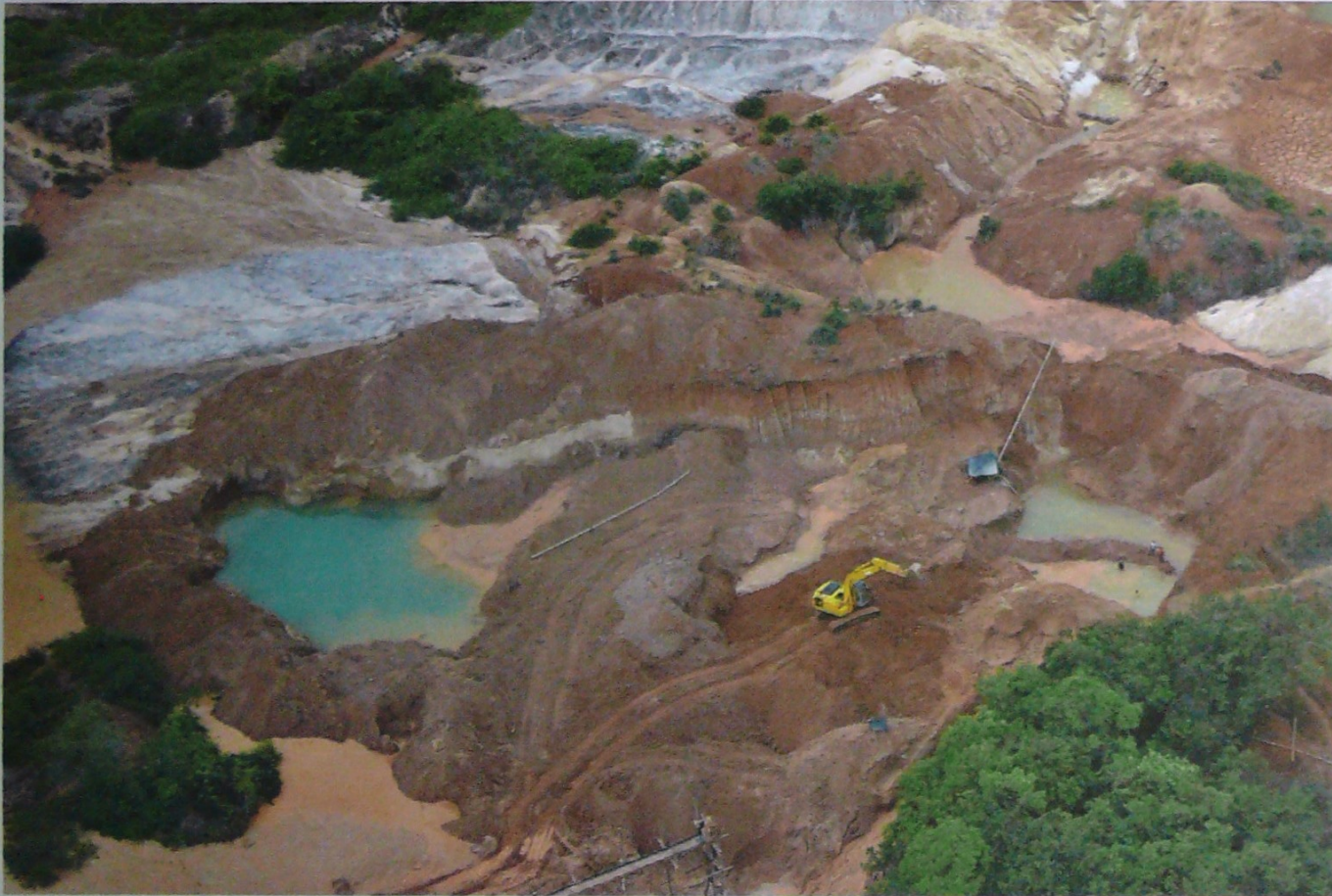
La mayoría de la producción de oro se exporta a Estados Unidos, Suiza y Canadá.

La cotización seguiría subiendo el resto del año