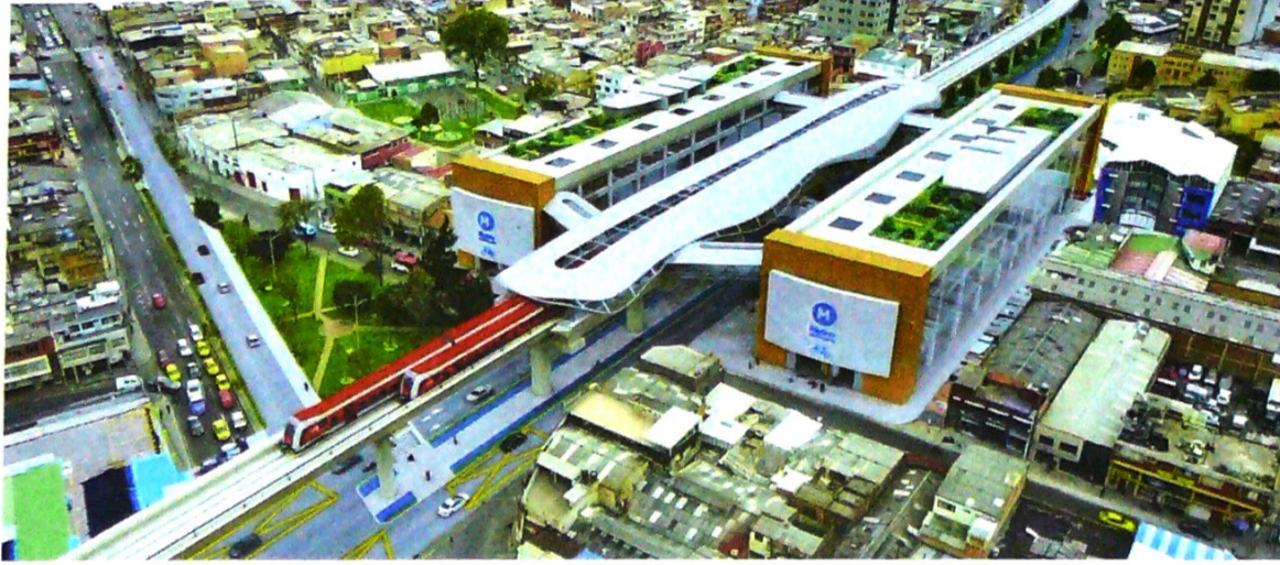
Esta es una imagen proyectada del metro que Bogotá espera adjudicar en octubre próximo.

Esta semana, la Secretaría de Planeación visitará la localidad de Santa Fe con el Supercade móvil y la Feria Distrital de Servicio al Ciudadano. Será los días 22, 23 y 24 de agosto en la calle 1ª F con carrera 7ª para orientar y asesorar en trámites como el Sisbén y otros asuntos de planeación.