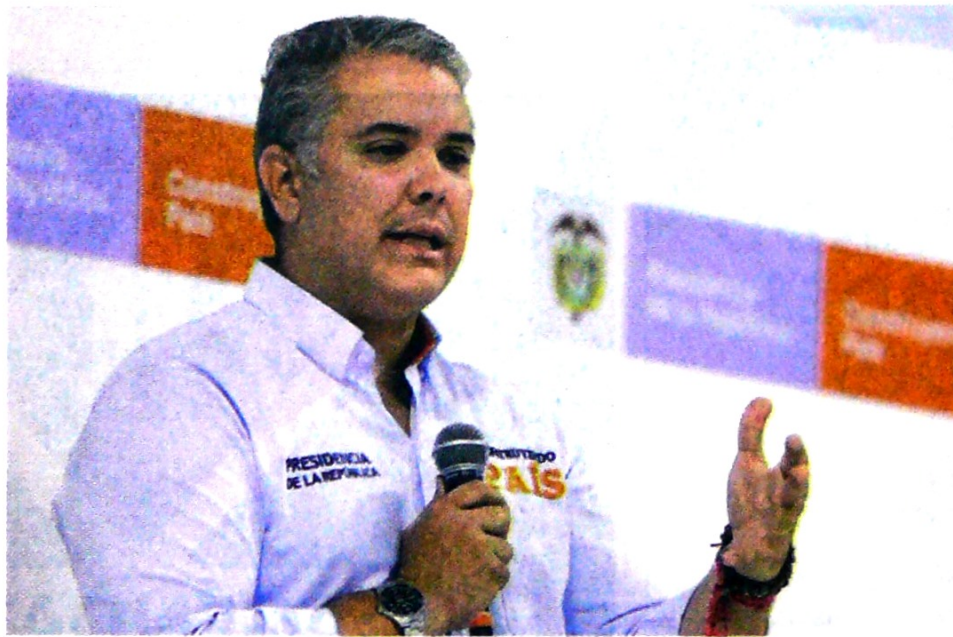
El presidente Iván Duque confirmó la creación de una 'holding' financiera, con el fin de ganar sinergia entre entidades. Este diario conoció que estaría lista en dos meses.

EMPRESAS comprenden el portafolio minoritario de la Nación, es decir, allí tiene participaciones de menos de 50%. El Gobierno saldría de algunas de estas posiciones, a través de Cisa.