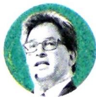
ALBERTO CARRASQUILLA Ministro de Hacienda

“En este sector se han identificado importantes sinergias entre empresas que desarrollan objetos sociales similares, así como entre compañías que atienden diferentes nichos de mercado pero en donde es posible aprovechar alianzas comerciales. Con este enfoque (...), el Gobierno busca generar ahorros y recursos para la Nación en el corto plazo que eventualmente le puedan significar ingresos adicionales a los es-