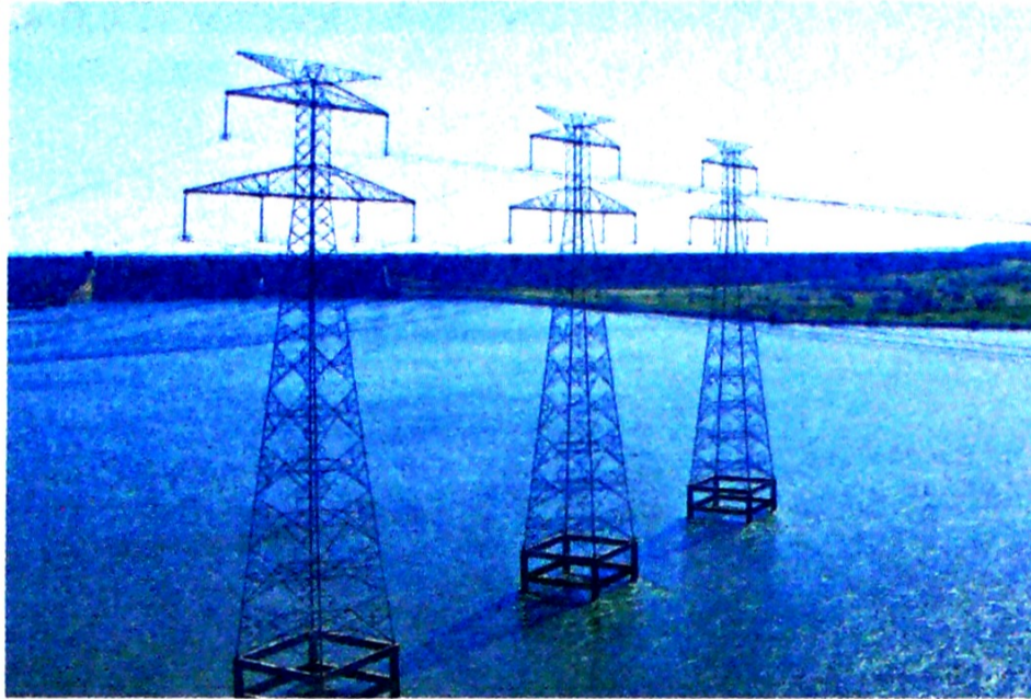
El Gobierno contrató una consultora, con el fin de saber si vende o no su participación de 51% en la empresa Interconexión Eléctrica S.A. (ISA). Este año se conocerán sus resultados.

Los nombres exactos no se conocen aún, pero, entre tanto, el Minhacienda