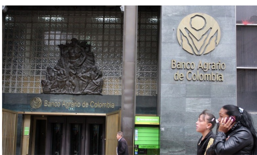
Banco Agrario.