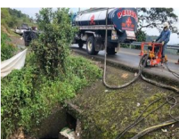
Una vez asegurada por la Fuerza Pública la zona del atentado, Ecopetrol inició con el plan de contingencia. Labores todavía continúan

"Una vez se conoció el hecho, Ecopetrol suspendió la operación del oleoducto y notificó al Consejo Municipal de Gestión del Riesgo de Barbaacos", informó Ecopetrol .