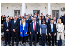
Gobernadores resisten medidas de Macri