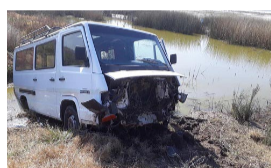
Una combi se despistó en la ruta 1