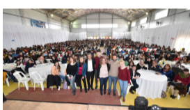
Inició en Toay el programa Aprender a Gobernar