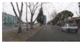
Copos de nieve y una tarde noche con una térmica de -4°C