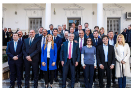
Gobernadores rechazan medidas de Macri y podrían ir a la Justicia