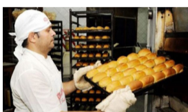
Sugieren un valor de 85 a 95 pesos para el kilo pan