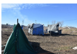
Le pegó un "fierrazo" a su suegra y fue preso