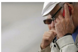
Advierten sobre una nueva modalidad de estafa telefónica