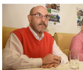
Aumentan los medicamentos