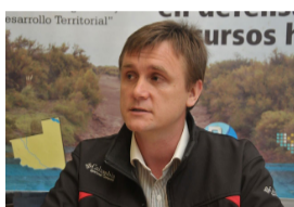
Convocan a una asamblea de la Cuenca del Colorado en 25 de Mayo