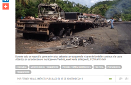
Domante julio se registró la caída de varios vehículos de carga en la vía que de Medellín conduce a la costa Atlántica en jurisdicción del municipio de Vidales, en el Norte antioqueño.

COLOMBIA | MINISTERIO DE TRANSPORTES | TRUCKS, TRANSPORTADORES | POLÍTICA | SEGURIDAD | TRANSPORTES