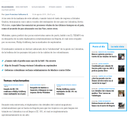
Kevin Whitaker, embajador saliente de Estados Unidos en Colombia.

RESUMEN: Whitaker, quien pedirá dar por sus actividades antes de partir, habló con EL TIEMPO en su despacho de la sede diplomática estadounidense en Bogotá, el cual está ocupado por su sucesor, Philip Goldberg, hacia embajadas de replantación.