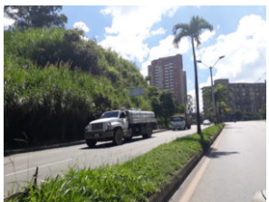
Radio Santa Fe CM

Tags de esta nota: Aire • calidad • Estrategia