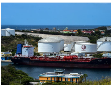
Venezuela podría quedarse sin opciones sin la ayuda de CNPC para cargar su petróleo.

POR: BLOOMBERG - AGOSTO 16 DE 2019 - 10:00 A.M.