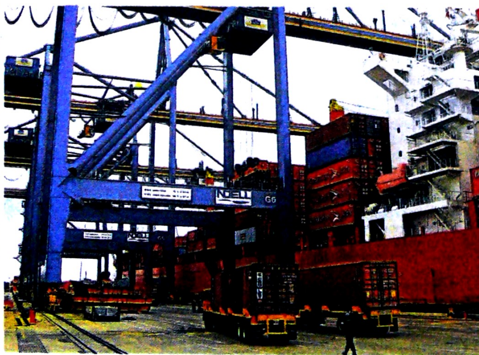
Las exportaciones colombianas han tenido una menor dinámica durante el año.

do se compara con países exitosos en ese sector, lo que podría ser una de las razones para el bajo movimiento de esta industria el comercio externo del país".