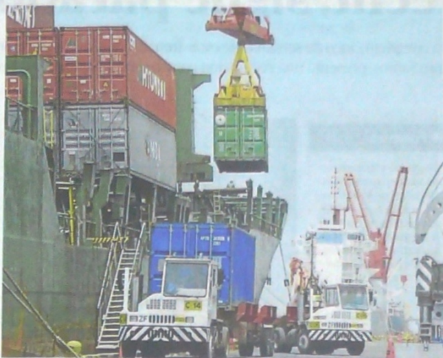
Las tres zonas portuarias regionales del país movilizaron en el primer semestre del año, 97,8 millones de toneladas de carga, con una variación de -2,4% frente a igual periodo de 2018.

En el semestre, las tres zonas portuarias del País (Caribe, Pacífico y Río Magdalena) movilizaron 97,8 millones de