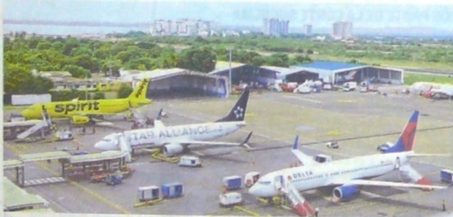
Plataforma del Aeropuerto Internacional Rafael Núñez, de Cartagena.

Del total de la carga que se mueve por la Zona Portuaria de Cartagena, el 58,1% es contenerizada, convirtiendo a esta ciudad en un puerto especializado en carga de este tipo. Le sigue la carga de graneles líquidos (21,4%), graneles sólidos (17,6%), la carga