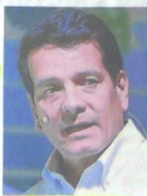
Felipe Bayón, presidente de Ecopetrol.

El beneficio del primer semestre antes de intereses, impuestos, depreciación y amortizaciones (Ebitda) alcanzó los