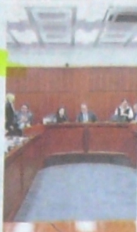
Sesión en la comisión V.

En las comisiones V de Senado y IV de Cámara se escucharon en debates de control político este martes fuertes críticas por los recortes en el Presupuesto a los sectores de agricultura y minas y energía. Agricultura tuvo este año una asignación de $2,4 billones, y en 2020 será de $1,79 billones. Minas pasa de $3,5 a $3,4 billones.