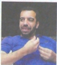
Senador Arturo Char

El senador explicó su intervención en un acto político el domingo.