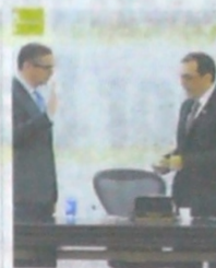
Senador Fabio Amín

Por lo anterior, la jefe de la cartera de infraestructura concluyó: "Lo que hemos hecho nosotros es ponerle la cara al país, hacer pública la información y trabajar de la mano del Estado para sacar adelante los proyectos. (...) Con esta explicación yo tengo derecho a que me resarzan mi prestigio y mi buen nombre, porque en realidad yo lo único que he hecho es trabajar para devolverle a los colombianos sus vías y la credibilidad en las obras".