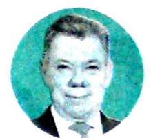
Carlos Holmes Trujillo, canciller.

El Consejo Nacional Electoral abrió indagación preliminar al expresidente Juan Manuel Santos, por el caso de los dineros de Odebrecht.