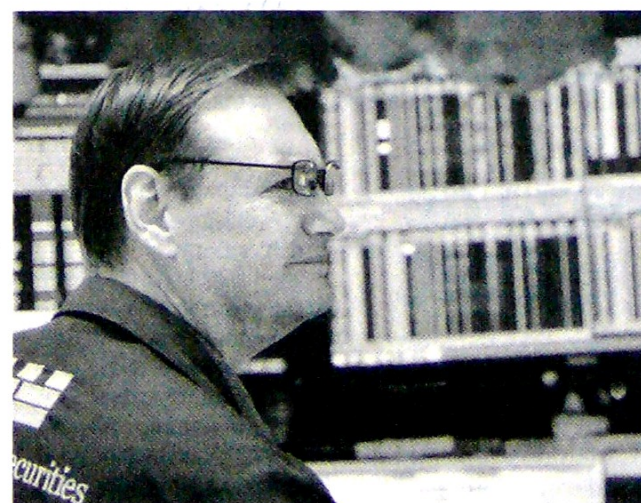
Los inversionistas recibieron de manera positiva la nueva 'trégua' de Donald Trump en algunos aranceles a China.

Según un informe de investigaciones económicas de Bancolombia, ese mínimo "estuvo influenciado por la postergación en la aplicación de aranceles a ciertos productos por parte de EE.UU. a China y la recupe-