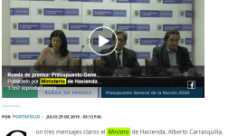
Rueda de prensa: Presupuesto Gene. Publicado por Ministerio de Hacienda. 1.507 reportajes. Rueda de Prensa. Presupuesto General de la Nación 2020

Por: PORTAFOLIO - JULIO 29 DE 2019 - 03:13 P.M.