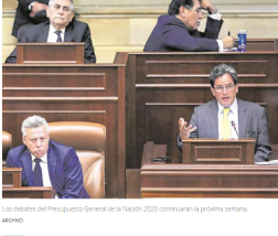
Los debates del Presupuesto General de la Nación 2020 continuarán la próxima semana.