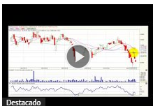
Video análisis técnico Bolsa de Colombia – 13 de agosto