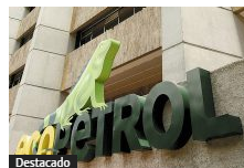
Ecopetrol Consolidado – Informe trimestral de resultados a Junio 30 de 2019