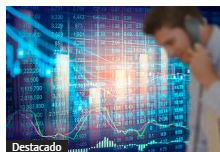
Repuntan acciones en EE. UU. tras retraso en aranceles de administración de Trump a China