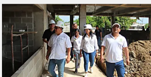
Alcalde de Cartagena entregará obras para los niños, el arte y la cultura