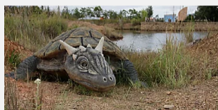
Un nuevo género de dinosaurios, descubierto por casualidad