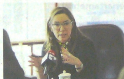
La ministra de Minas y Energía, María F. Suárez.

La ministra, quien hizo ayer un balance de su gestión en el primer año de Gobierno, aseguró que