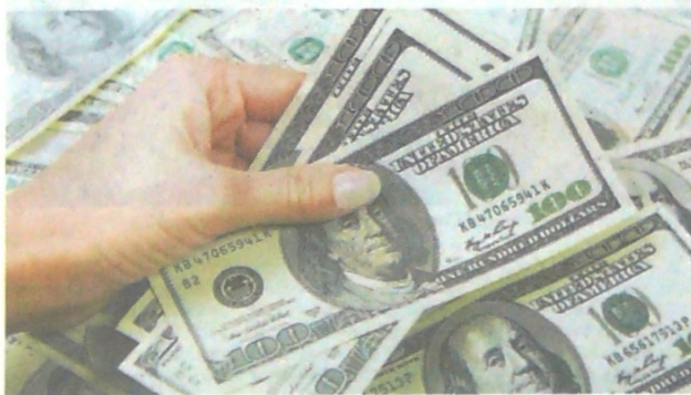
Varios billetes de dólar, divisa que tocó el precio máximo histórico en el país.