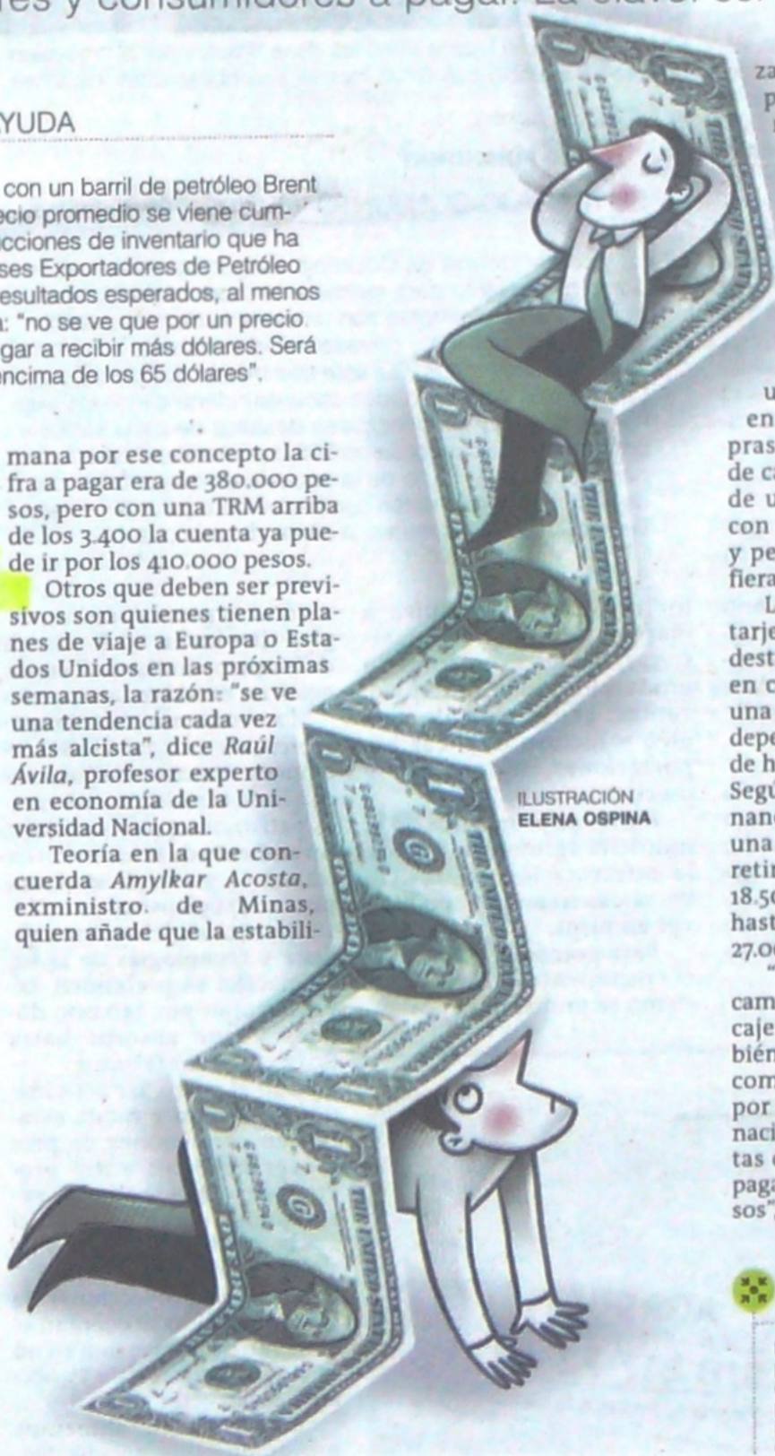
ILUSTRACIÓN ELENA OSPINA

"Seguiría siendo mejor el cambio previo al viaje pues los cajeros en el extranjero también tienen topes de retiros, y como se ve, las comisiones por esos movimientos internacionales son mucho más altas que el precio que se debe pagar con una TRM a 3.500 pesos", concluye Ávila ■