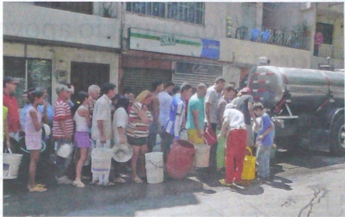
Con carrotaques que suministran el líquido a los ciudadanos, EPM suele suplir la falta de acceso al servicio. En este caso se afectaron 7.730 clientes en San Cristóbal.