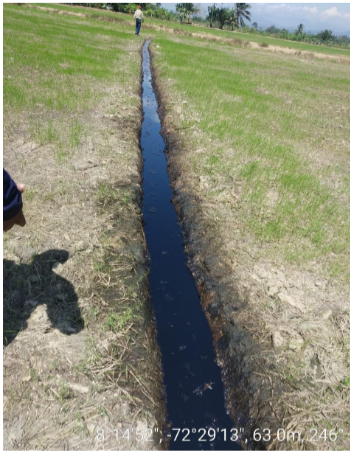
8°14'52", -72°29'13", 63.0m, 246

Ecopetrol activó el plan de contingencia en la vereda Restauración, corregimiento Buena Esperanza, zona rural del municipio de Cúcuta, como consecuencia de la instalación de una válvula ilícita al Oleoducto Caño Limón-Coveñas para el poderamiento de hidrocarburo.